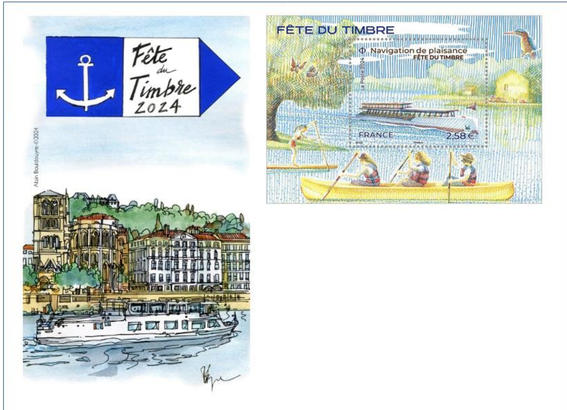
Grande enveloppe FFAP